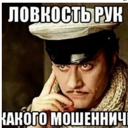
Схема 7. Представляются госслужащими

Часто мошенники звонят или пишут человеку якобы от лица сотрудников ФСБ, налоговой, портала "Госуслуги". Самая распространенная уловка - предложение получить какую-либо госвыплату. Схема классическая: вы нам данные карты, мы вам - деньги.