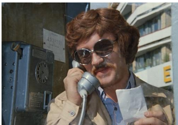
Схема 9. Ваш родственник попал в ДТП

Запомните: сотрудники правоохранительных органов никогда не будут требовать от вас совершить финансовые операции или предлагать по телефону возместить кому-то ущерб. Операции по поимке преступников в дистанционном режиме не проводятся.