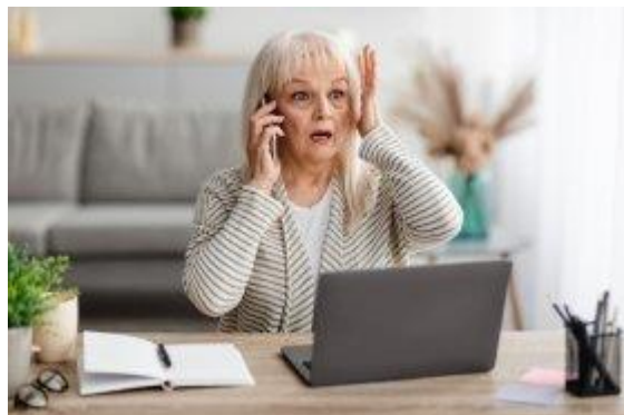
Схема 2. Предложения от лжеброкеров

Что делать? Вы можете обновить персональные данные, обратившись за услугой лично, - в офисе оператора связи или в личном кабинете на его официальном портале (но не по ссылке из смс). Не называйте никаких данных незнакомым по телефону. Если сомневаетесь, позвоните оператору связи по номеру, размещенном на официальном сайте.