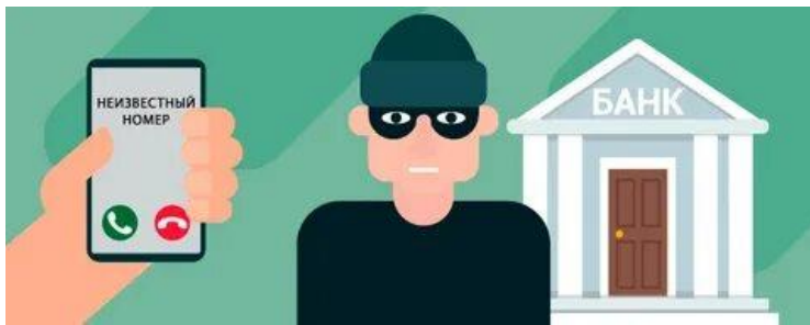
Схема 6. Звонки из банка

Как платить, чтобы не потерять деньги? Оплачивайте услугу только через официальное приложение сервиса, а не через камеру гаджета.